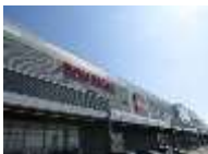
イオンモール佐野新都心 (約970m) 徒歩12分