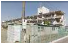
佐野市立界小学校 (約1,700m) 徒歩22分