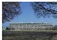
佐野市立南中学校 (約1,200m) 徒歩15分