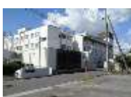
佐野医師会病院 (約1,600m) 徒歩20分