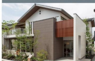
シャーウッド前橋みなみ展示場