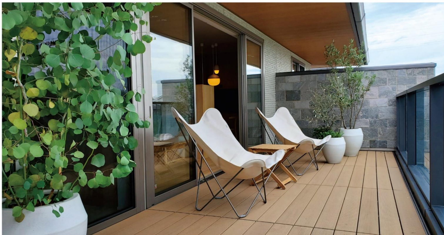
※掲載の写真はイズよしおか展示場ものです。