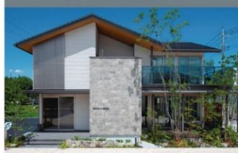
イズ伊勢崎展示場

北群馬郡吉岡町大字大久保550-1 上毛新聞マイホームプラザよしおかパーク会場内