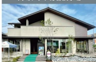
高崎プラザ総合展示場