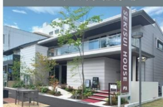
シャーウッド高崎展示場