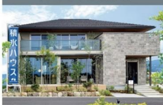
イズよしおか展示場